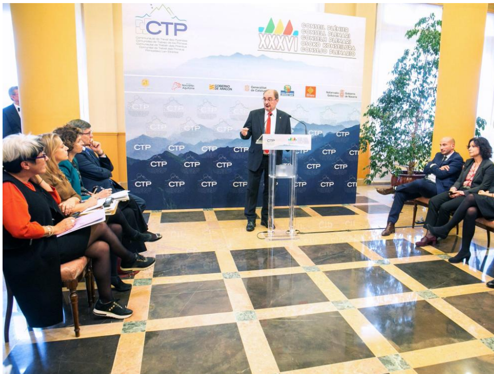
Intervención del presidente de Aragón, Javier Lambán, en la celebración del XXXVI Consejo Plenario de la CTP.

Aragón forma parte en el marco de la Comunidad de Trabajo de los Pirineos de 27 proyectos que tratan temas que van desde las infraestructuras sanitarias, la recuperación de aves necrófagas