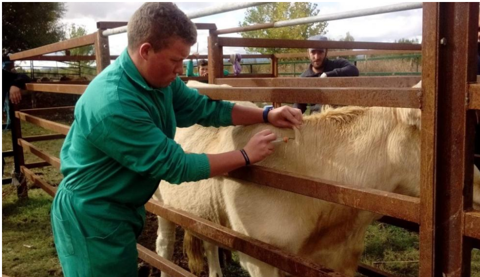
Prácticas de ganadería en el centro de FP San Blas de Teruel.

Otro proyecto muy ligado al territorio es el Reino del Aneto , que nació originalmente ya en 2013. Liderado por el Ayuntamiento de Benasque y por la Fundación Hospital de Benasque, se ha traducido en varias acciones para promocionar la zona , entre ellas la creación de la app Ruta 3404, con rutas de tres recorridos que salen de Luchón hasta el Puerto de Benasque, pasando por el Hospital de Francia. Colabora asimismo en actividades como el intercambio de escolares entre el Collège Jean Monnet Luchon el y C.R.A Alta Ribagorza.